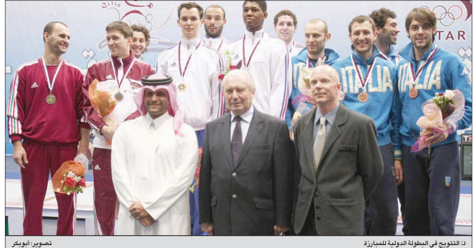
التتويج في البطولة الدولية للمبارزة

وخلص الشيخ سعود إلى القول بأن ما يقوم به الاتحاد القطري للمبارزة يتماشى مع سياسة اللجنة الأولمبية القطرية الهادفة إلى نشر مبدأ الرياضة للجميع والمساهمة في نشر روح السلم والتضامن».